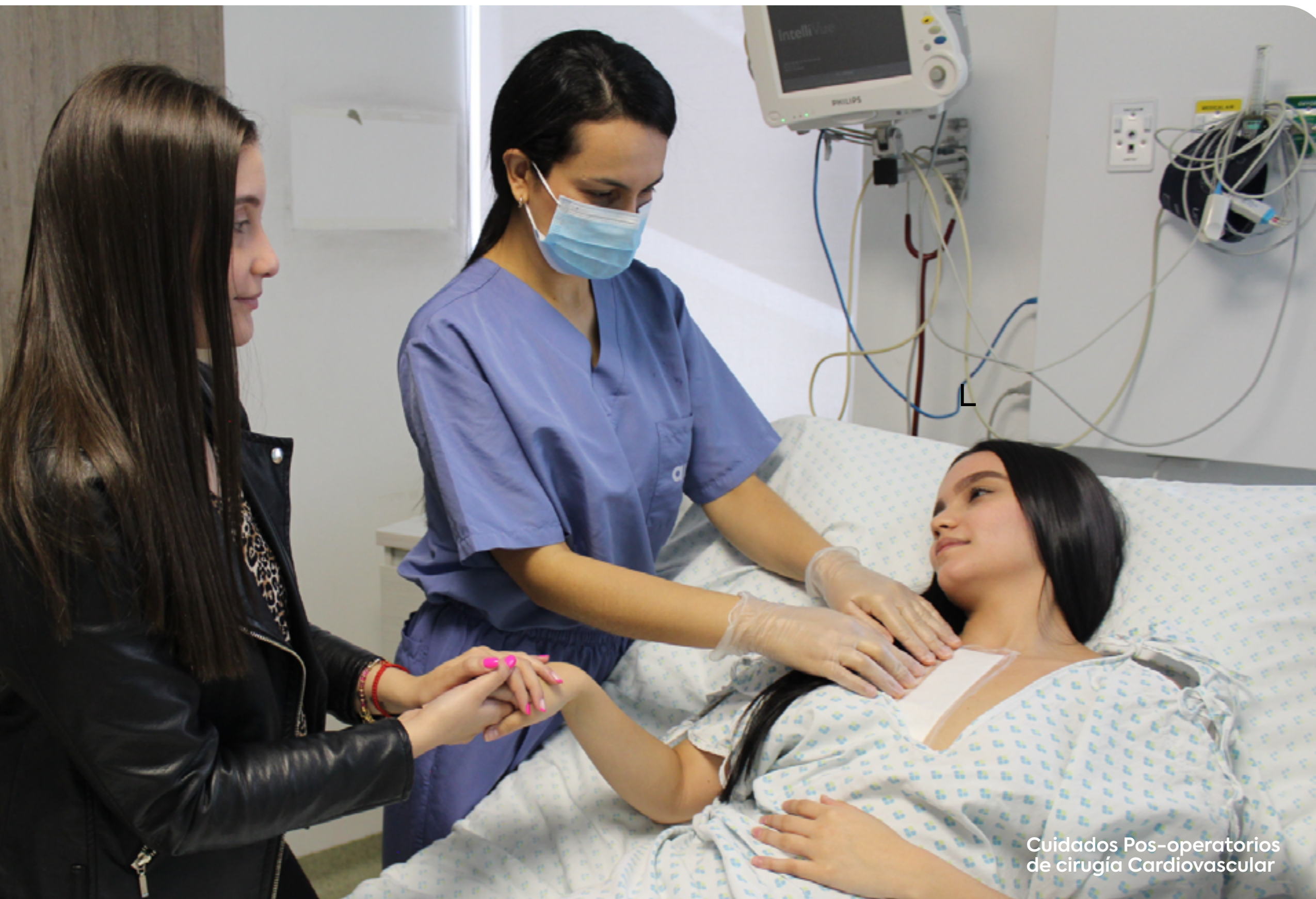
Cuidados Pos-operatorios de cirugía Cardiovascular