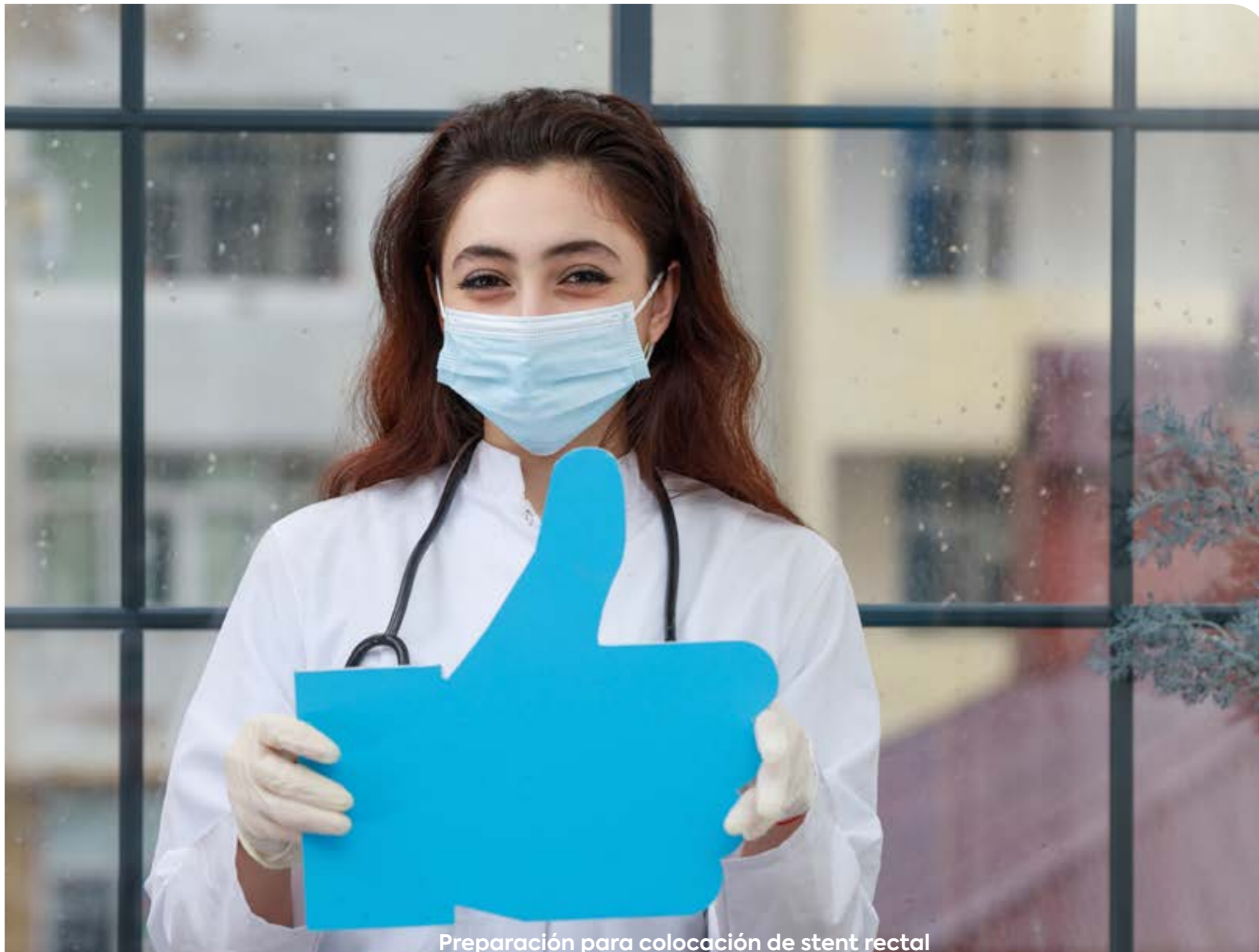
Preparación para colocación de stent rectal