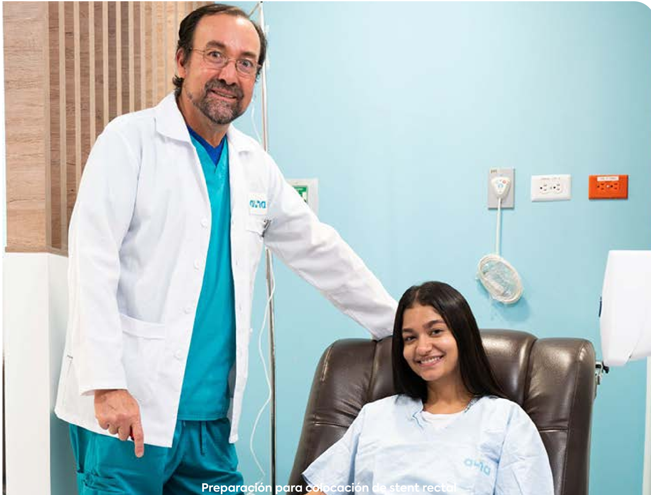
Preparación para colocación de stent rectal